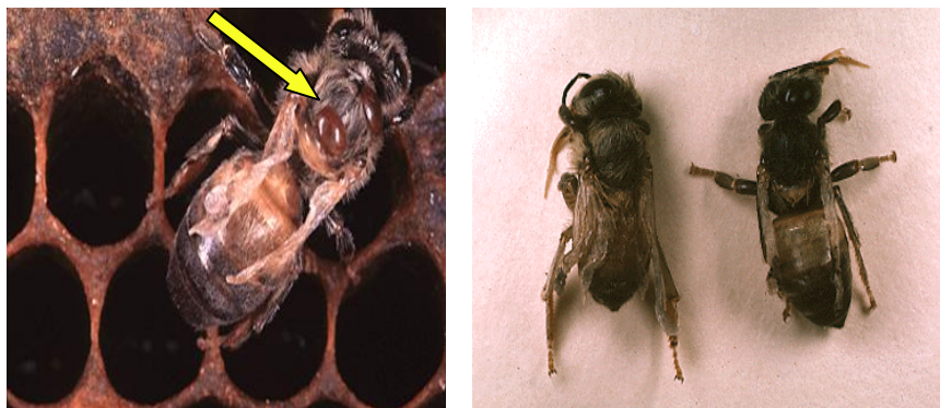
Figura 3. Abejas deformes por daños producidos durante su vida larvaria

Al examen clínico se observó que el 35 % de las colmenas del apiario estaban débiles, que había una alta población de zánganos y las varroas se veían fácilmente caminando por los panales y encima de las abejas, indicando una alta contaminación. También se encontraron abejas deformes, pequeñas y sin alas. (Fig. 3) La flecha indica los ácaros adheridos a la abeja.