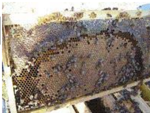
Figura 4. Panal con abundantes crías de obreras y fortaleza de abejas.

Al mes siguiente de la introducción del zanganero, disminuyó el porcentaje de infestación por varroa al 5 % y las colmenas involucradas tenían una alta población de abejas sanas, incrementándose notablemente los rendimientos productivos.