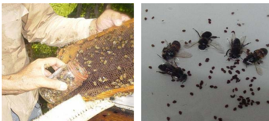
Figura 4. Toma de muestras de abejas en el campo y conteo de abejas y ácaros.

Una vez realizado el lavado de abejas, se procedió a contarlas y las varroas presentes se vaciaron en un recipiente que poseía un paño de color claro para facilitar el conteo, siendo el porcentaje de infestación de 18; corroborándose el diagnóstico presuntivo. (Fig. 4).