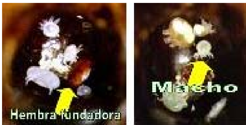
Figura 1. Ácaros de varroa hembras y machos.

La Varroasis es una enfermedad parasitaria invasiva de la abeja Apis mellífera que afecta a todas las castas (obreras, reina y zánganos) en los estadios de adultas y crías producida por el ácaro Varroa destructor (1, 2,3) (Fig. 1).