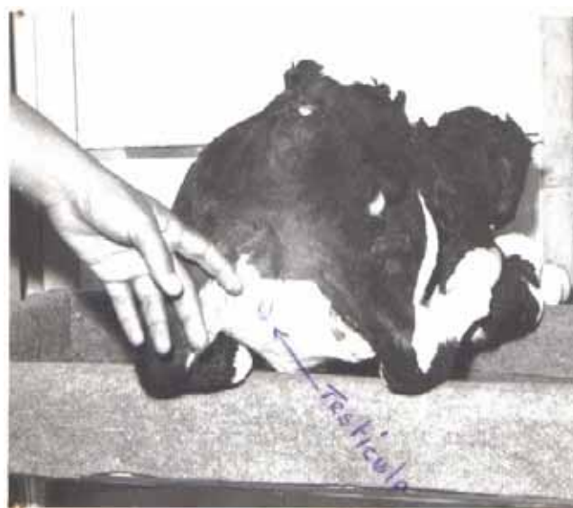
Foto 1. Decúbito prono (parte trasera). Testículo rudimentario. La pieza descrita puede ser observada en el Museo Municipal de Cauto Cristo, Granma, Cuba.

Se observaron duplicidades del esófago, tráquea, corazón y pulmones.